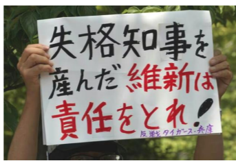
県庁前の抗議集会(7月19日)

どういいうぐ頭の構造なのか？東日本大震災で大変な事故を起こした福島第一原発、その事故処理問題は、解決していない。なのに経産省は、新規原発の建設を進め、その経費は消費者の電気代に転嫁するという。 ▼忘れられない写真がある。原発事故で人気なくなった町中を、瘦せてガリガリになった数匹の犬がうろついていた。場所は福島県双葉町。犬たちの頭上には「原子力明るい未来のエネルギー」と、道路をまたぐ大看板が掲げられていた。 ▼朝日新聞の連載「てんでこに「被災馬物語」が載った。伝統行事「相馬野馬追」を絶やさぬため約30頭の馬は特別助けられたと。それ以外の馬、牛、豚、鶏は餓死か殺処分。建立された「獣魂碑」には「放射能の存在すら知ることなく空腹に鳴き続け息絶えた牛たちよ(略)許して下さい」と刻む。