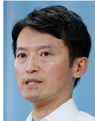
兵庫県政史に間違いなく悪名が残る斎藤元彦・知事 1977年11月に神戸市須磨区に生まれる。愛光中学・高校(松山市)から東京大学経済学部。総務省に入り、三重県、宮城県など出向。2021年8月より兵庫県知事