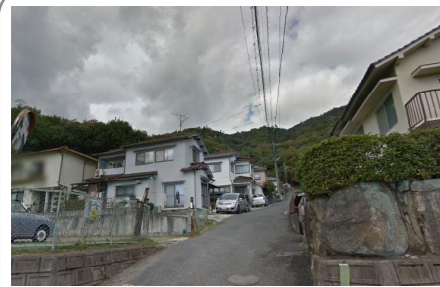
広島市安佐南区八木3丁目の被災前の風景。神戸市灘区の摩耶山の足下にそっくり

50th 246 ▼今から10年前の2014年8月20日、広島市安佐南区(あさみなみく)、同北区を中心に線状降水帯による大規模な土砂災害が起きた。 ▼私たちの生かすニュースも同年9月号で報じた。それは広島市の災害地域が、あまりにも灘区とよく似ていたからだ。広島も六甲山も花崗岩が風化した「まさ土」が多く、被災前写真を見てもそっくり。10年を迎えた広島では、法要と災害防止を誓ったという。神戸でも防災のため一層の点検と努力を。