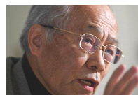
さたか まこと 佐高 信 さん